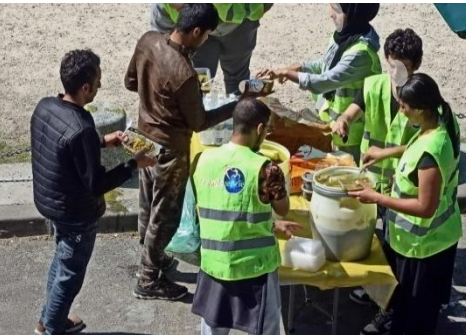
...préparée et servie par des bénévoles...