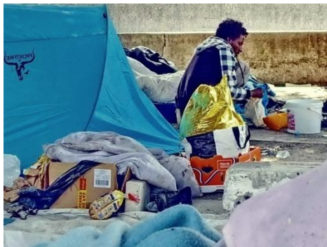
L'organisation d'un campement provisoire...