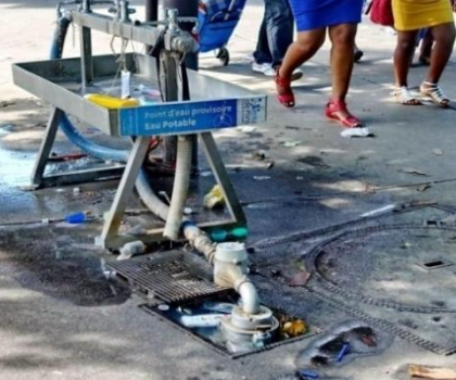
...bien que tellement précaire !