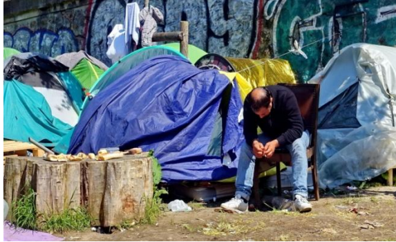
Puis vient une attente indéfinie pour une espérance infinie.