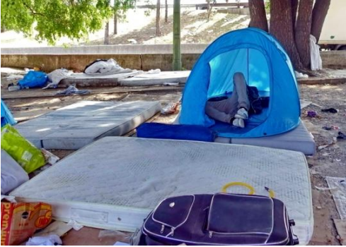
...mais si possible un tant soit peu durable....