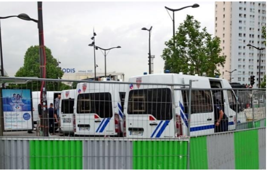
Mais les « gardiens de la paix » veillent, pas loin, prêts...