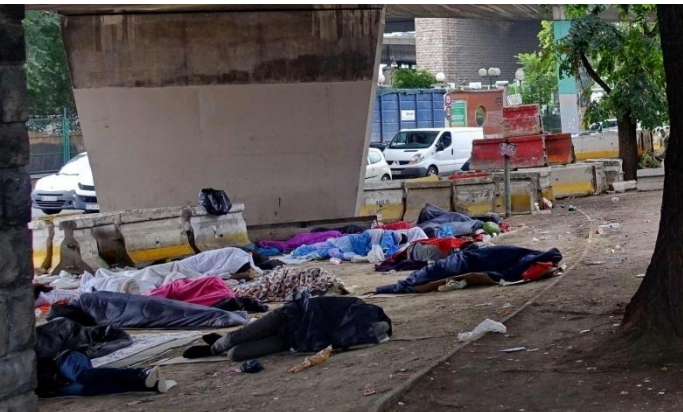
Dépourvus, à la rue, ces « voyageurs du bout du monde » persistent à...