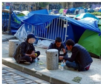
...et partagée solidairement à même le sol