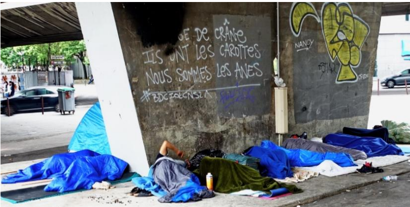
...chercher refuge, pensant peut-être aussi « ils ont les carottes, nous sommes les ânes »

Vive l'hospitalité ! Et bravo la fraternité qui trône sur le fronton de nos établissements publics !