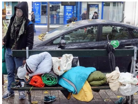
...et masquer un problème devenu trop visible