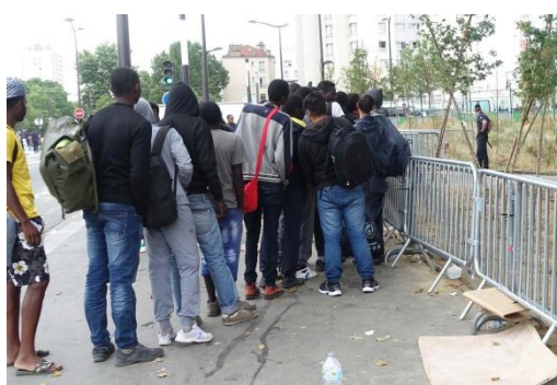
La queue pour tenter d'accéder à la demande d'asile