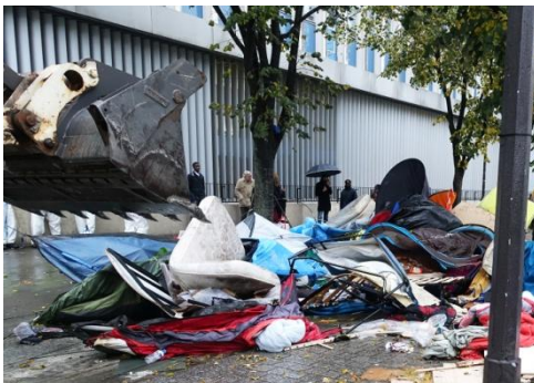
...à intervenir sur ordre politique pour tout détruire...