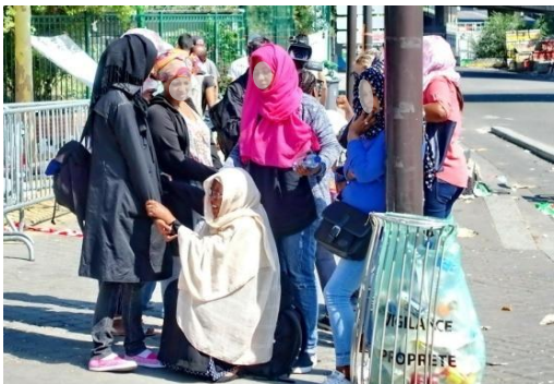
Le partage des informations, sans obligation pour survivre